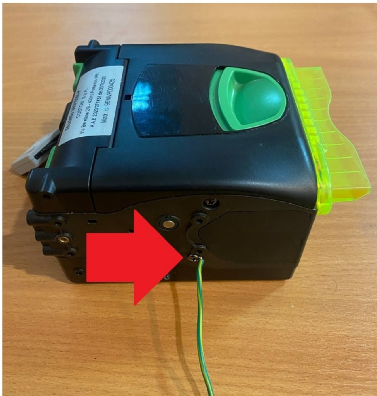
Рисунок 1. Заземление CUSTOM VKP80III-ФА.

Заземление ККТ CUSTOM VKP80III-ФА, происходит медным кабелем (рисунок 1):